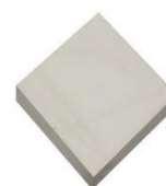
200 x 200, tl. 40-80 mm

COMCON® CDR jsou hladké dlaždice určené především pro lemování signálních, varovných a hmatných pásů pro osoby se zrakovým postižením v šíři nejméně 250 mm k dosažení funkčního hmatového kontrastu vyžadovaného vyhláškou č. 398/2009 Sb.